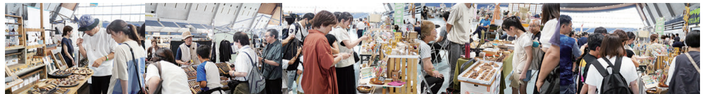
※写真は2024年エムウェーブ開催の様子です。

購買意欲の高い優良顧客層が、入場料を支払って多数来場する 信州ハンドクラフトフェスタは、クラフトファンにとってマストな2日間です。