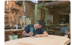
※写真は過去のパブリシティの様子

●テレビ局の共催による コマーシャル効果大! TVコマーシャル・TV番組内 パブリシティ多数