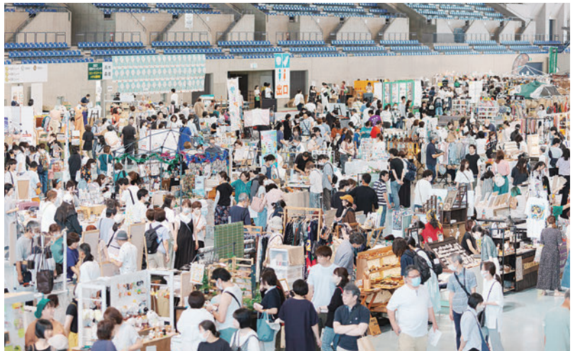
※写真は2024年エムウェーブ開催の様子です。

●テレビ局の共催による コマーシャル効果大! TVコマーシャル・TV番組内 パブリシティ多数